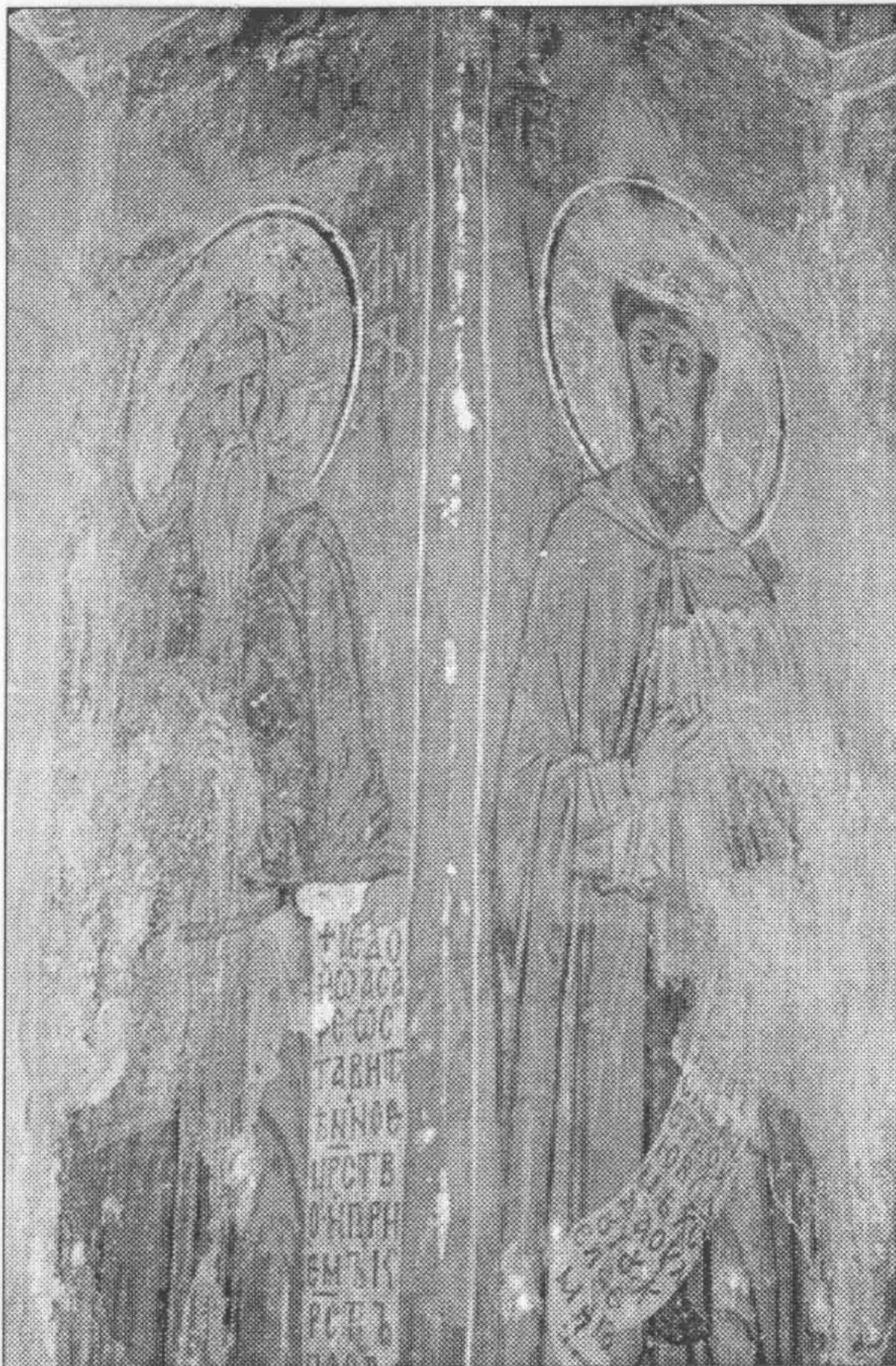
Варлаам и Јоасаф, манастир Свјуденица

Стара српска књижевност у 24 књиге књига двадесет друга