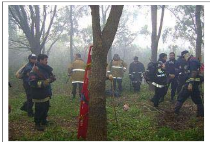
Bomberos y Personal de Emergencias avanzando hacia las zonas afectadas por el fuego en Zárate (Provincia de Buenos Aires)

• Los Directores de Emergencias de la ciudad, relatan las experiencias vividas durante el operativo desplegado en Zárate, en Abril de este año, para ayudar con la extinción del fuego.