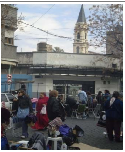
Fieles de San Cayetano

"Es común que en las largas colas de fieles, que se van armando en los días previos a la apertura de la Iglesia, algunas personas se descompongan o se desmayen puesto que a veces, no comen bien o pasan frío al permanecer en el lugar por las noches" comentó Roldán, quien resaltó "la enorme importancia de contar tanto con el Hospital Móvil de Defensa Civil -como un lugar seguro adonde trasladar al paciente-, como con la labor del personal del SAME para atender este tipo de casos y cubrir así las necesidades de salud que pudieran presentarse", aseguró.