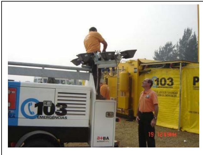
Puesta en marcha de las torres de iluminación