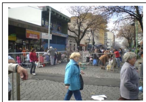
Vallados preventivos en los alrededores del Santuario