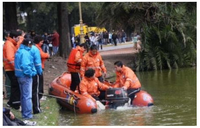
Personal de Emergencias en los lagos de Palermo

Participaron las Direcciones Generales de la Subsecretaría (Defensa Civil, Guardia de Auxilio y Emergencias y Logística) y otras áreas de Gobierno tales como el S.A.M.E., Cuerpo de Agentes de Control de Tránsito y el Transporte, Espacios Verdes, Seguridad Vial, Tránsito, así como entidades voluntarias (Bomberos Voluntarios de la Boca, Vuelta de Rocha y San Telmo, Cruz Roja Argentina y Asociación de Voluntarios para la Defensa Civil).