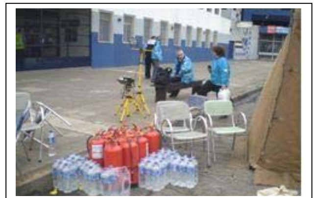
Equipamiento y personal de la Subsecretaría ubicados en las cercanías de la Iglesia