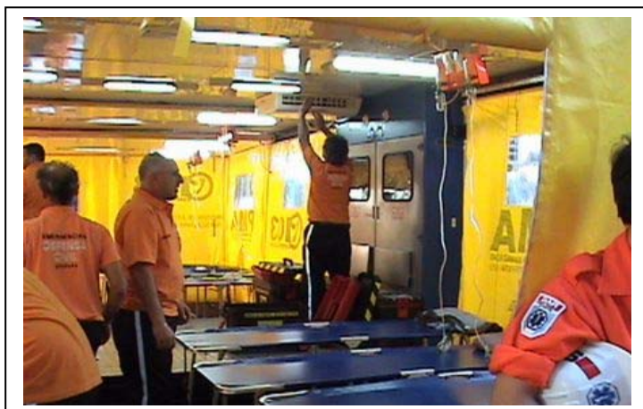
Amado del Puesto Médico de Avanzada

Y a su vez, después de los 15 días de trabajo con todo el agotamiento que esto supone, hubo dos situaciones que contribuyeron a formar e integrar mucho más al grupo, de lo que ya estaba: por un lado, la despedida con los bomberos y la gente con la que estuvimos trabajando allá y por otro, el encuentro con los compañeros que habían estado en terreno y que estaban esperándonos en Buenos Aires, o el hecho de llegar y que estuviera el jefe de Gobierno esperándonos para darnos la bienvenida, los abrazos que se dieron entre los compañeros que estuvieron y los que no pudieron ir...La verdad fue espectacular”.