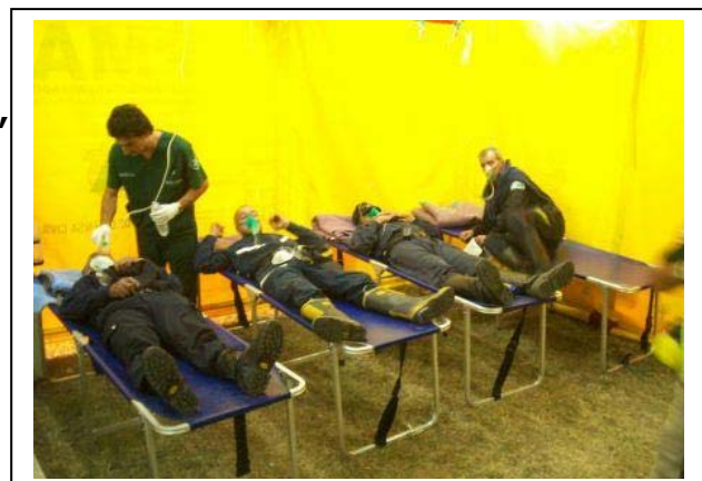
Puesto Médico de Avanzada (PMA)