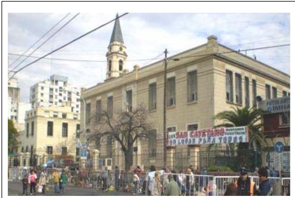
Iglesia de San Cayetano en el barrio de Liniers

La Subsecretaría de Emergencias realizó -como cada año- el operativo preventivo de San Cayetano, del cual participaron aproximadamente 250 personas, quienes asistieron a los miles de fieles congregados en el Santuario de Liniers. Saldo positivo para uno de los operativos que se despliegan en la ciudad.