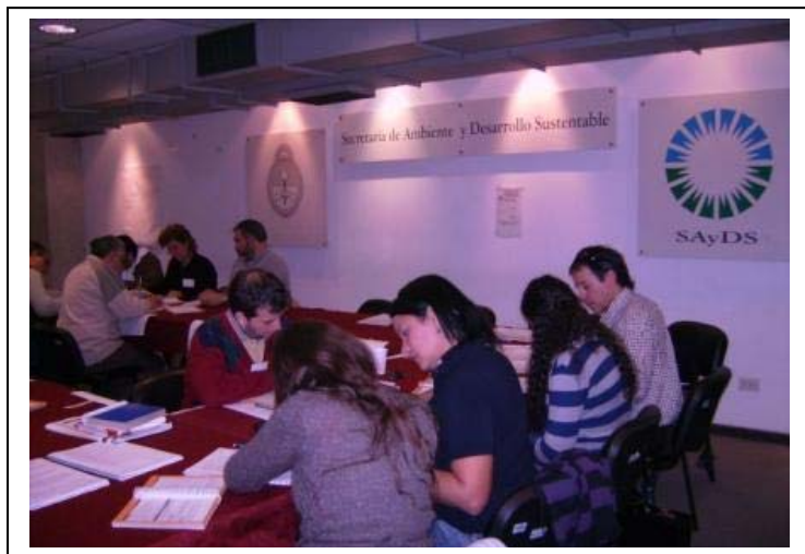
Curso Primera Respuesta con materiales peligrosos

Las actividades de la pasantía se completaron con: visita al (CAS Centro de Análisis de Situación) y (CAR Centro de Análisis de Riesgo), Jornada de trabajo organización Simulacro sobre Víctimas Masivas, visita a la escuela Gregorio la Ferrere como apoyo para capacitación a los niños sobre Riesgos en el Hogar, Programa Comunitarios de Defensa Civil, visita a la Superintendencia Federal de Bomberos, visita al SAME, concurrencia al Operativo con motivo del Día de la Primavera al Parque 3 de Febrero.