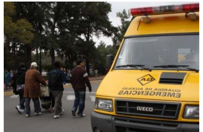
Móvil de Emergencias recorriendo el Parque Tres de Febrero

Desde las 8:00 hs. y hasta pasadas las 20:00 hs, el personal de la SSEMER, recorrió las zonas cubiertas por los operativos de manera constante, a fin de detectar irregularidades, prevenir la ocurrencia de incidentes, ofrecer información y orientación y brindar atención médica. El trabajo previo comenzó con un relevamiento efectuado en las distintas zonas el día jueves y la ubicación de vehículos de Logística, el día sábado, para reservar los sitios que ocuparían los móviles de Emergencias.