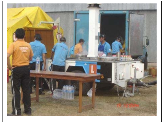
Despliegue de elementos y provisiones

“En ningún momento nadie nos cuestionó la cantidad de horas de trabajo o tener que salir fuera de la jurisdicción. La gente demostró una predisposición al trabajo y un profesionalismo dignos de destacar.” Gonzalo Fuertes