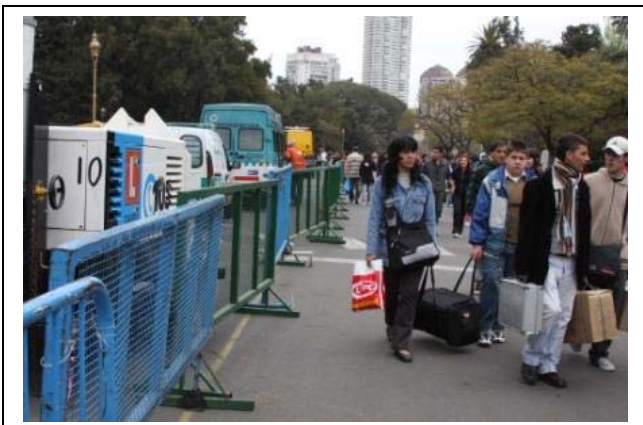
Móviles de Emergencias en Palermo

* 57 fueron asistidos en el P.M.A. (Puesto Médico de Avanzada) por lipotimia y traumatismos leves con la colaboración del personal de la Subsecretaría de Emergencias.