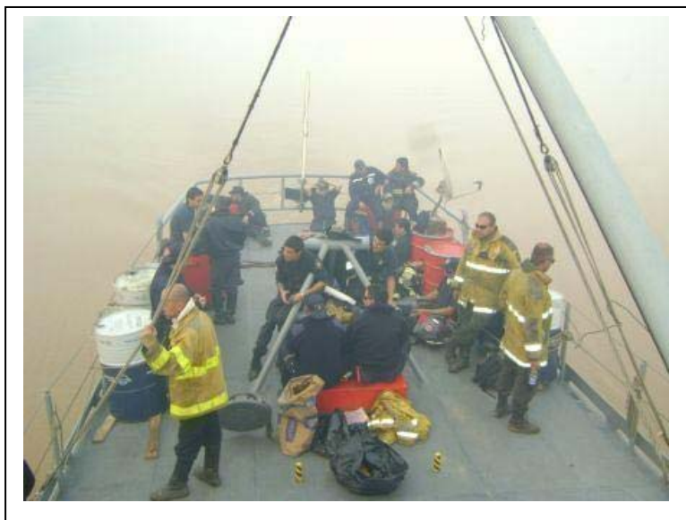
Personal de la Subsecretaría en una embarcación de Prefectura

Russo: “Nosotros pudimos prescindir de todo elemento; no tuvimos que solicitar nada en el lugar; fuimos a dar y a autoabastecernos: tanto lo hicimos en el ámbito de la información con este COE móvil, como con el área de alimentación, porque mediante la cocina de campaña de Logística le dimos las cuatro raciones diarias de comida a 400 personas. Y quería comentar lo útil que fue para los bomberos, contar con un plato de comida de calidad, caliente, abundante. Hasta que llegamos estaban con sanguchitos nada más... y contar también con el respaldo médico, ya que el SAME estuvo permanentemente con nosotros y compartió este esfuerzo, con profesionalismo”.