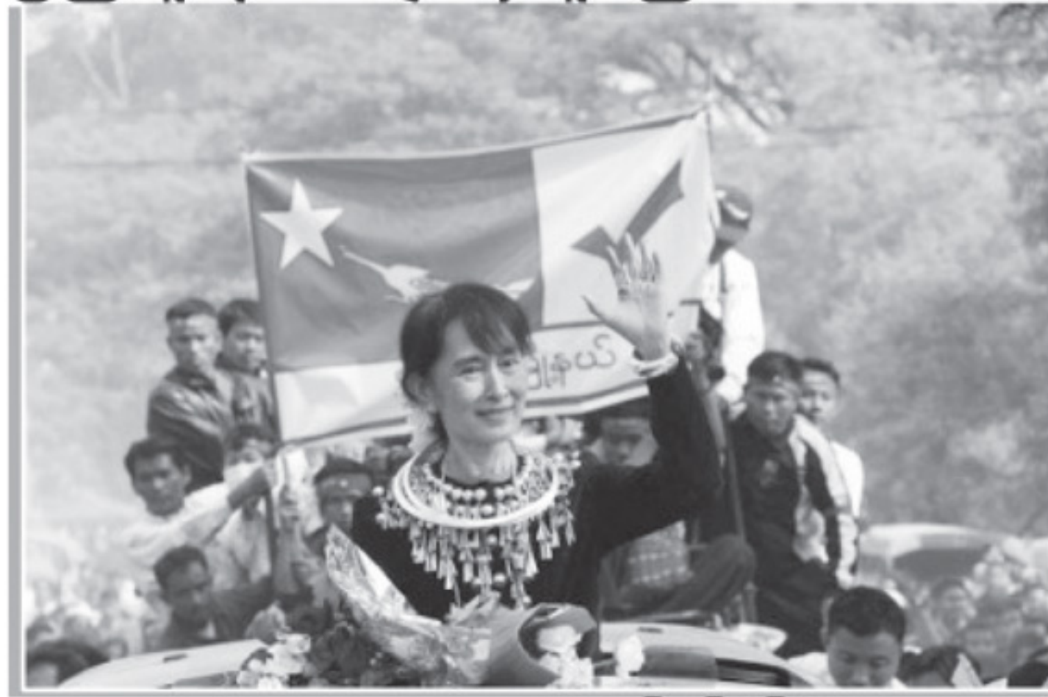
မောင်ကိုကို(အမရပူရ)