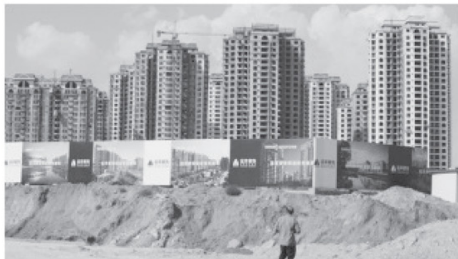
တရုတ်နိုင်ငံ၏ ပျက်စီးလုနီးပါးဖြစ်သွားသော အိမ်ရာ စီမံကိန်းများထဲမှ ပုံသဏ္ဌာန်တစ်ခု။