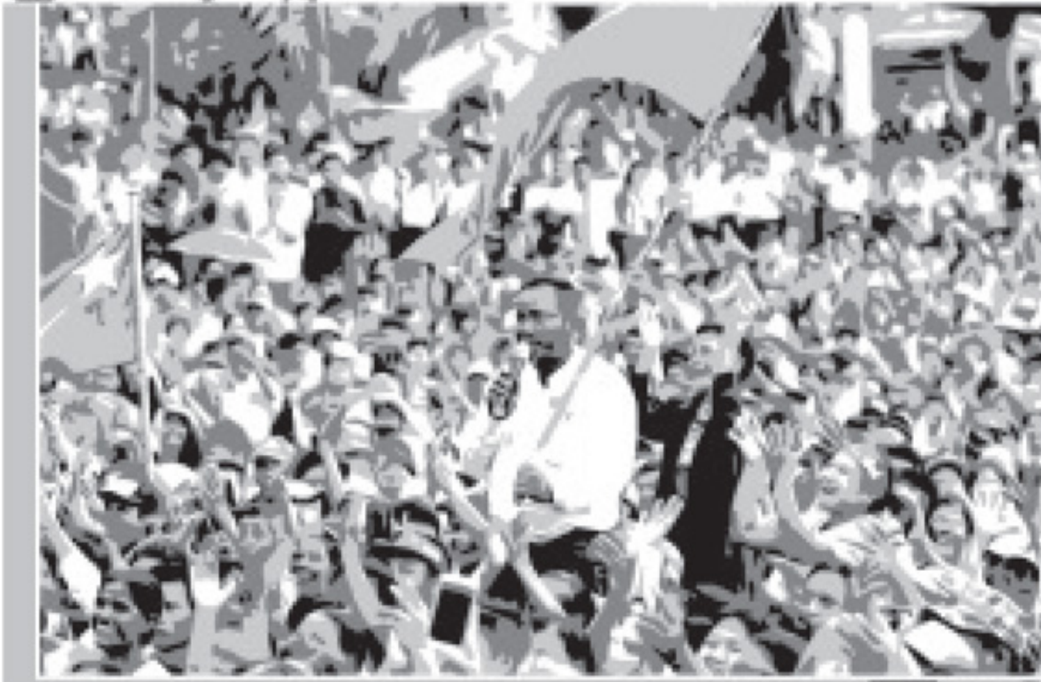
ကြီးနှစ်

သွားရမယ့် လမ်းခရီးမှာ အခုအခံအတားအဆီးဖြစ်နေတဲ့ တောင်တစ်လုံးတွေတဲ့အခါ ဘာ လုပ်ကြမလဲ။ ကျောက်တောင်ကြီး ဆိုရင်တော့ ဥပင်လိုဏ်ခေါင်း ဖောက်ရမှာပေါ့။ ကျုပ်တို့ မြန်မာ ပြည်သူပြည်သားတွေရဲ့ ကာယ စိတ္တနှစ်ဖြာကျန်းမာ၊ ချမ်းသာရေး လမ်းခရီးမှာ ပိတ်ဆို့ ဟန့်တားနေ ခဲ့တာကတော့ ထုနဲ့ထည်နဲ့ ကြီးမား လှတဲ့ ခြတောင်ပို့ကြီးခင်ဗျ။