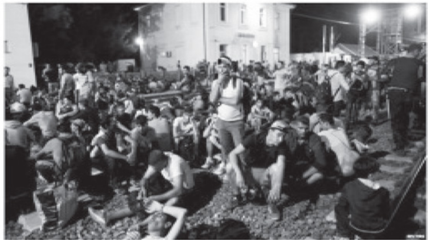
ခရိုအေးရှားနိုင်ငံ နယ်ခြားမြို့ တိုဝ်နစ်၌ ရွှေ့ပြောင်းလာသူ ဒုက္ခသည်များ ရွှေ့ဆက်သွား၍မရသဖြင့် စောင့်ဆိုင်းနေကြရသည်။

နယ်ခြားမျဉ်းကို ဖြတ်ကျော်သည့် လမ်းဆို၍ ဘဲလ်