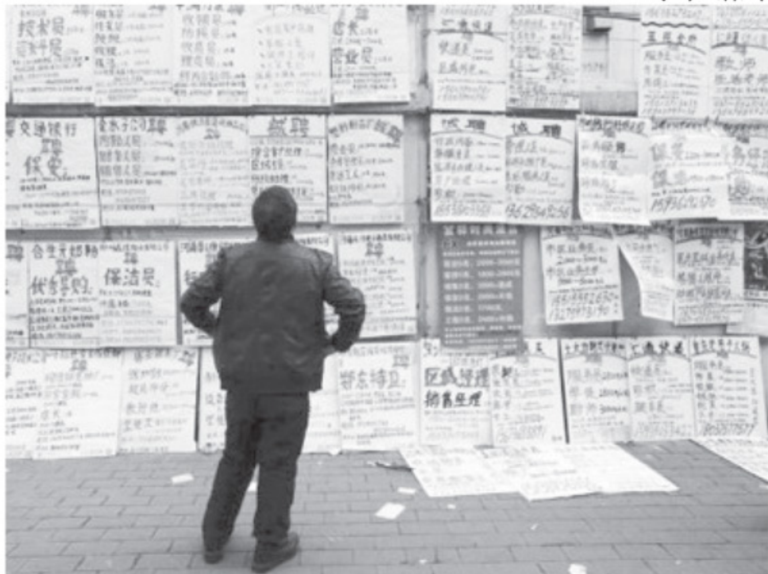
အလုပ်အကိုင် အခွင့်အလမ်းသစ်များရလိုချင်၊ အလုပ်ခေါ်စာ ကြော်ငြာများအား ကြည့်ရှုနေသည့် လူငယ်တစ်ဦး။