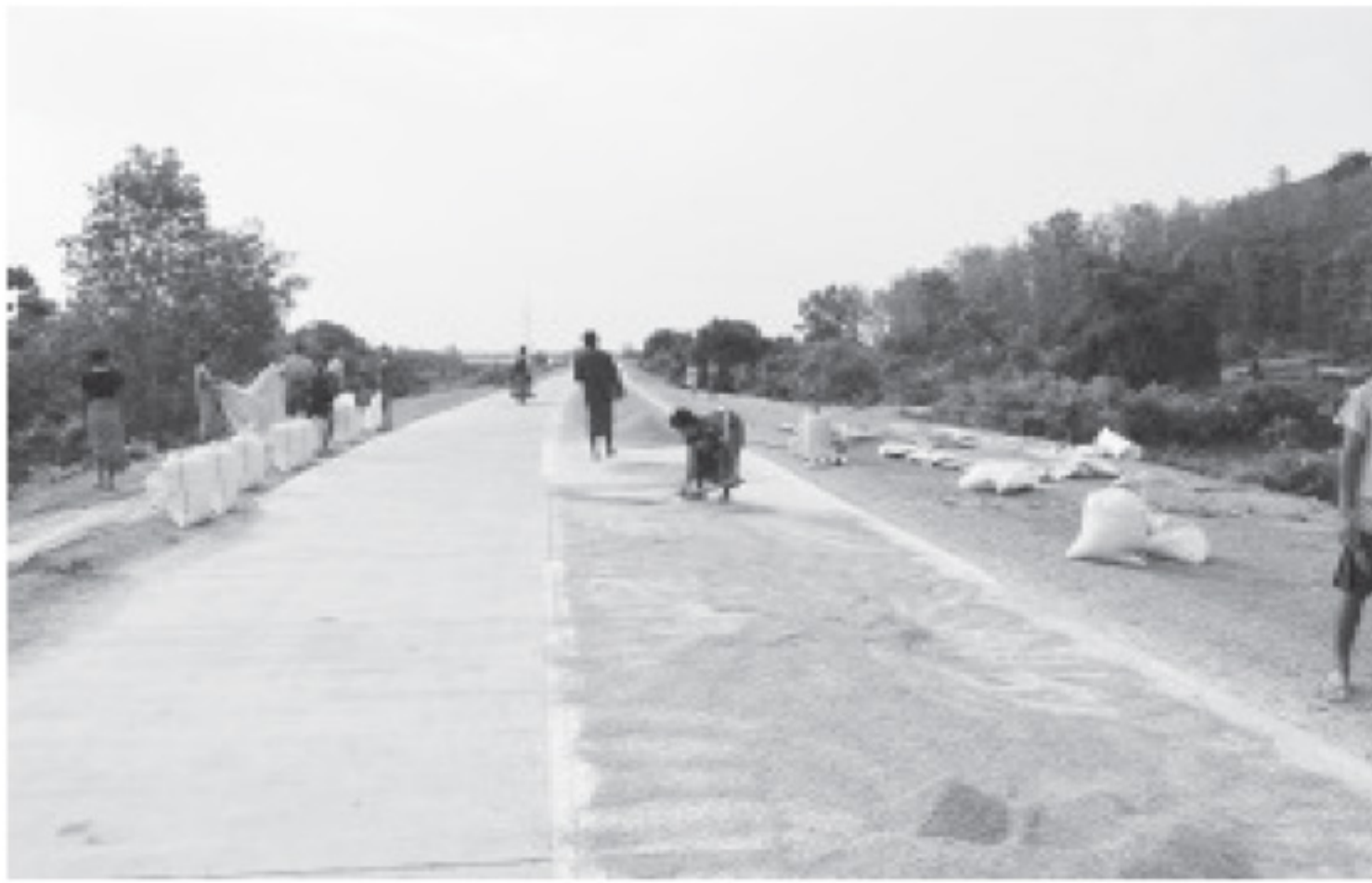
ရေကြီးနစ်မြုပ်မှုကြောင့် ပျက်စီးသော ဝမ်းစာစပါးများ နေလှန်းနေသည်ကို တွေ့ရစဉ်။

ရခိုင်ပြည်နယ်၏ အဓိက စီးပွားရေးလုပ်ငန်းဖြစ်သည့် လယ်ယာလုပ်ငန်းပျက်စီးဆုံးရှုံးမှုကြောင့် မိုးစပါးအမြန်ဆုံး စိုက်ပျိုးနိုင်ရေးအတွက် တောင်သူများ အားသွန်ခွန်စိုက် ပြန်လည်စိုက်ပျိုးခဲ့ကြသော်လည်း လယ်ကွင်းများတွင် ဖုံးလွှမ်းနေသည့် ရွှံ့နွံများကြောင့် စပါးများကို စိုက်ပျိုးသည့်နည်း စနစ်ဖြင့် မစိုက်ပျိုးနိုင်တော့