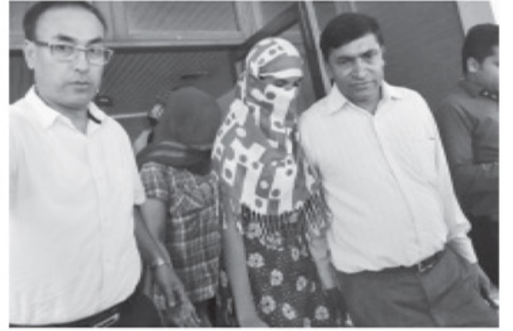
ဆော်ဒီသံတမန်၏ အဓမ္မကျင့်ခြင်းခံခဲ့ရသော အမျိုးသမီးနှစ်ဦးကို ဒေလီမြို့ ဂိဂန်အရပ်မှ ကယ်ဆယ်လာကြစဉ်။

ဆော်ဒီနိုင်ငံကမူ အဆိုပါ စွပ်စွဲချက်များ တစ်ခုကိုမှ လက်သင့်မခံ၊ သူ့နိုင်ငံသားကို အရေးယူခွင့်မပေးဘဲ၊ အိန္ဒိယနိုင်ငံတွင် ထို