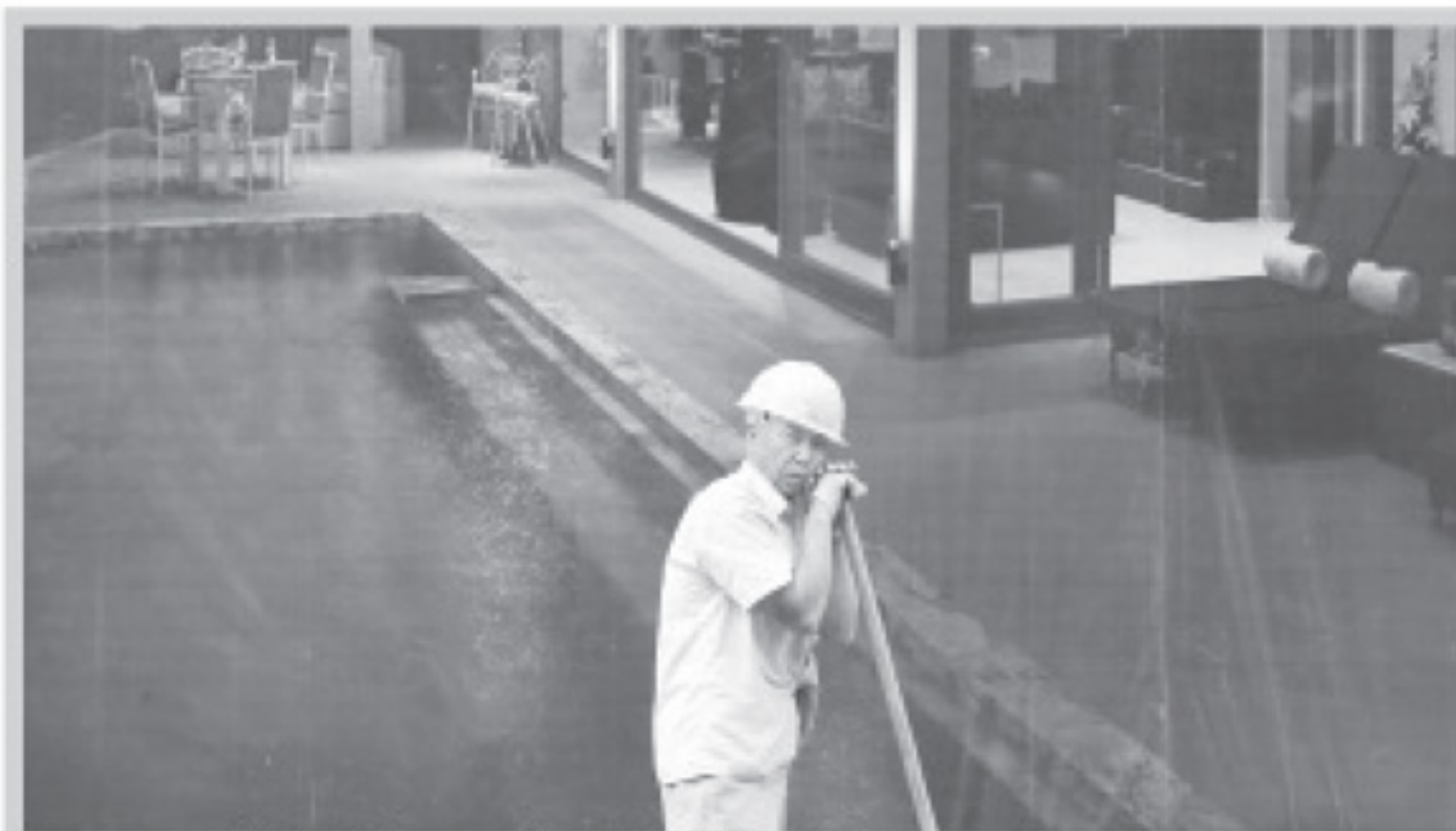
တရုတ်နိုင်ငံတွင် စီးပွားရေးထိုးကျနေ၍ စက်ရုံအလုပ်ရုံများမှ အလုပ်သမားများ လျော့ချနေရာ လျော့ချသည့်အလုပ်သမားထဲတွင် မိမိပါဝင်လေမည်လားဟု တချို့က စိုးရိမ်နေကြသည်။

ယနေ့တရုတ်နိုင်ငံ ရင်ဆိုင်နေရသည့် အခြေခံအကျဆုံး ပြဿနာမှာ တရုတ်နိုင်ငံ၏ စီးပွားရေး မညီမျှမှုဖြစ်နေခြင်းကို ပြည်တွင်း စီးပွားရေး၌သာမက နိုင်ငံတကာ စီးပွားရေး၌လည်းတွေ့ရှိပြီး နိုင်ငံ၏ စီးပွားရေးသည် တဖြည်းဖြည်း ထိုးဆင်းနေခြင်း ဖြစ်သည်။