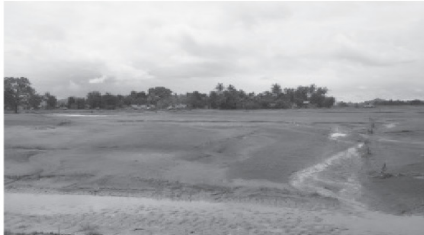
သဲဖုံးသွားသည့် ရေနစ်မြုပ်လယ်မြေများ